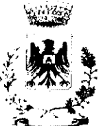
Comune di Ravanusa