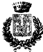
Comune di Campobello di Licata